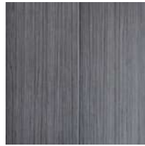
Dark Woven Grey