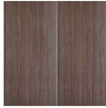
Dark Woven Brown